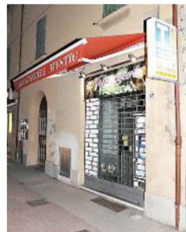
SULLA MONTANARA La fortuna ha baciato la tabaccheria 'Mystic' di Casalfiumanese