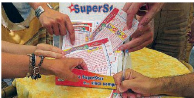
SuperEnalotto. Da ieri 45 nuovi milionari in tutta la Penisola

pri giocatori. Quella di stasera è la seconda vincita con punti sei del 2018. La sestina vincente è stata: 4, 17, 29, 55, 67, 70 - Jolly 72 - SuperStar 49. Il sei mancava dal 17 aprile 2018 quando è stata Caltanissetta ad aggiudicarsi il Jackpot del SuperEnalotto da 130,2 milioni di euro. Con quella di stasera sono 120 le vincite con punti 6 realizzate dalla nascita del SuperEnalotto . Il Jackpot SuperEnalotto vinto ieri si classifica nella 19esima posizione delle vincite più alte.