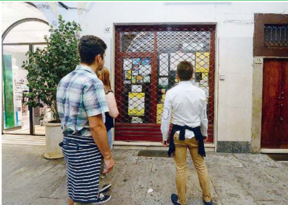
Il luogo. «La ricevitoria del corso», in corso Zanardelli 13, ha venduto una quota Superenalotto da un milione