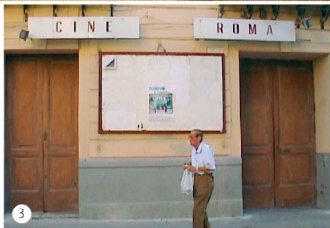
1. Un affresco di Palazzo Drago. 2. Un frame dal video di Marzia Migliora «Viddi la mia fortuna in alto mare». 3. Un frame tratto da un'opera di Domenico Mangano