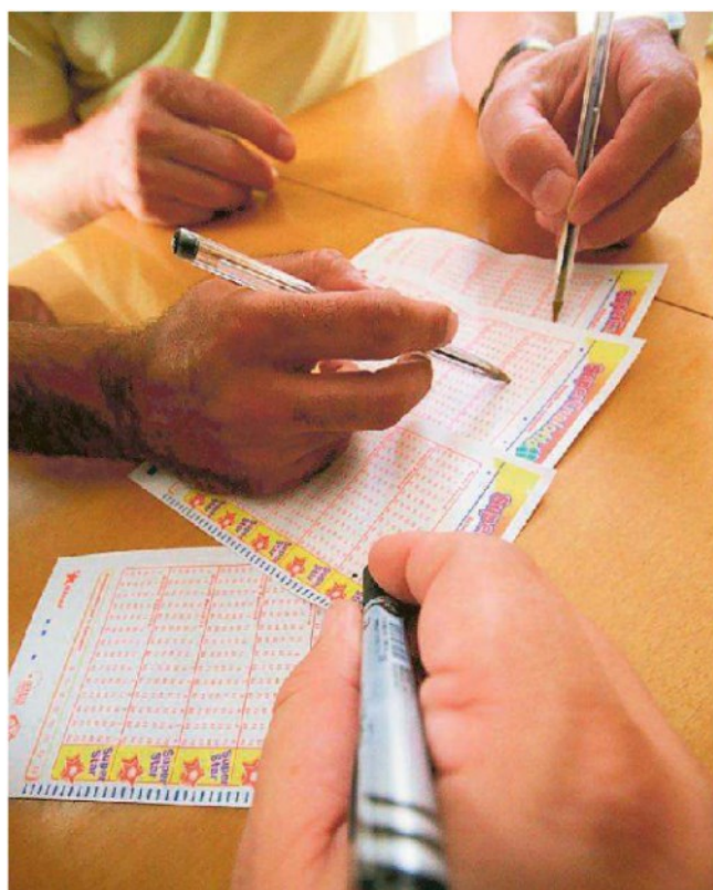
Ieri a Venezia una giocata vincente al Superenalotto da un milione