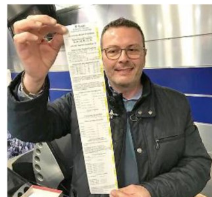
Il 6 centrato ieri sera al Superenalotto regala una vincita complessiva di oltre 51 milioni di euro

ne, venduta anche a Peccioli in provincia di Pisa. La sestina vincente è stata: 4, 17, 29, 55, 67, 70 - Jolly 72 - SuperStar 49. Il Jackpot vinto ieri sera si classifica nella 19ª posizione delle vincite più alte realizzate nella storia del gioco. Di seguito la classifica delle 10 vincite più alte. 30 gennaio 2010: 177.729.043 euro bacheca dei sistemi; 27 ottobre 2016 163.538.706 euro Vibo Valentia; 22 agosto 2009 147.807.299 euro Bagnone (Massa); 9 febbraio 2010 139.022.314 euro Parma e Pistoia; 17 aprile 2018 130.195.242 euro Caltanissetta; 23 ottobre 2008 100.756.197 euro Catania; 19 maggio 2012 94.836.378 euro Catania; 25 febbraio 2017 93.720.843 euro Mestrino (Padova); 1 agosto 2017 77.735.412 euro Caorle (Venezia); 27 dicembre 2010 71.895.694 euro Napoli.