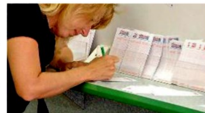
Nell'imolese sono stati vinti oltre 7 milioni